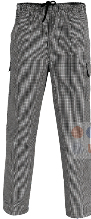
CON BOLSAS LATERALES