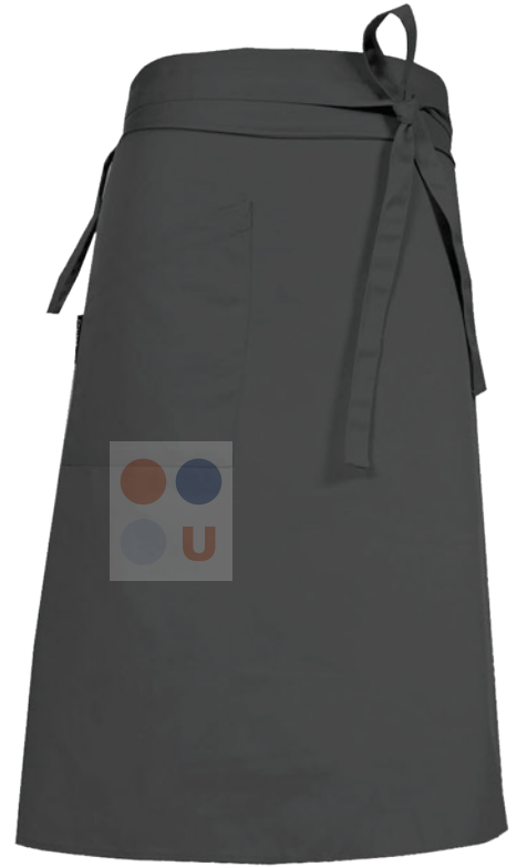
DOBLE CON BOLSA