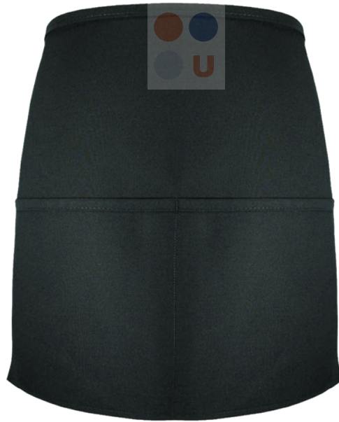
CORTO CON BOLSA