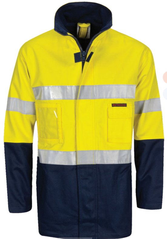
JACKET SEGURIDAD AV