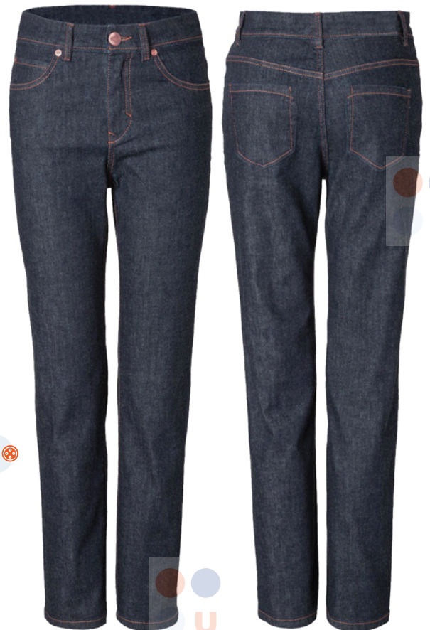
LONA DAMA ⊗