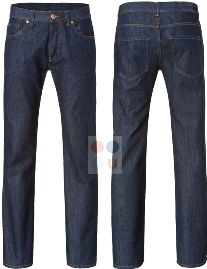
⊗ LONA CABALLERO